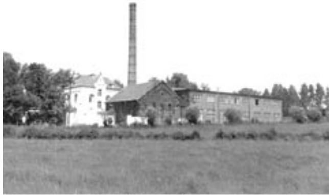
Streichgarnspinnerei Gilljam [4], ca. 1986

Über die Roermonder Straße und Schloß-Rahe-Straße gelangen Sie zur Soers, deren ländliche Struktur bereits hinter dem alten Bahndamm erfahrbar wird. Vorbei am Gelände von Schloß Rahe und den Resten der früheren Rahe-Mühle [3], einer bis in die 90er-Jahre produzierenden Getreide- und Futtermühle (im 17. Jh. Kupfermühle und im frühen 19. Jh. auch Nadelpolier- und Schleifmühle), gelangen wir zur 1891 errichteten Streichgarnspinnerei Gilljam [4] (Schloß-Rahe-Straße 23), die das Bachwasser nicht nutzte, aber das feuchte Klima am Wildbach für den Spinnvorgang benötigte. Der Betrieb produzierte bis 1969.