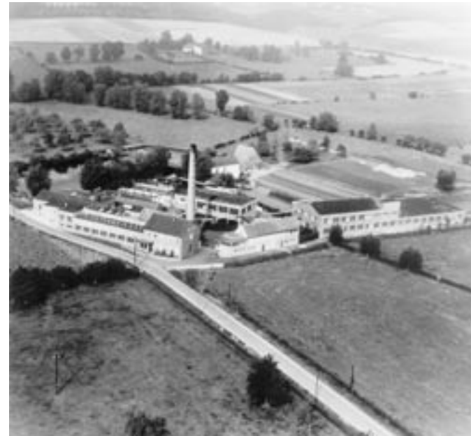
Stockheider Mühle [6], 1950

An einem alten Stauwehr vorbei, mit dem die Wasserzufuhr der nächsten Mühle geregelt werden konnte, gelangen Sie zur Stockheider Mühle [6], heute einem größeren Gebäudekomplex, das als Lager der (letzten) Aachener Tuchfabrik Becker (im Stadtteil Brand) dient und das im Kern noch Reste der früheren Mühle enthält.