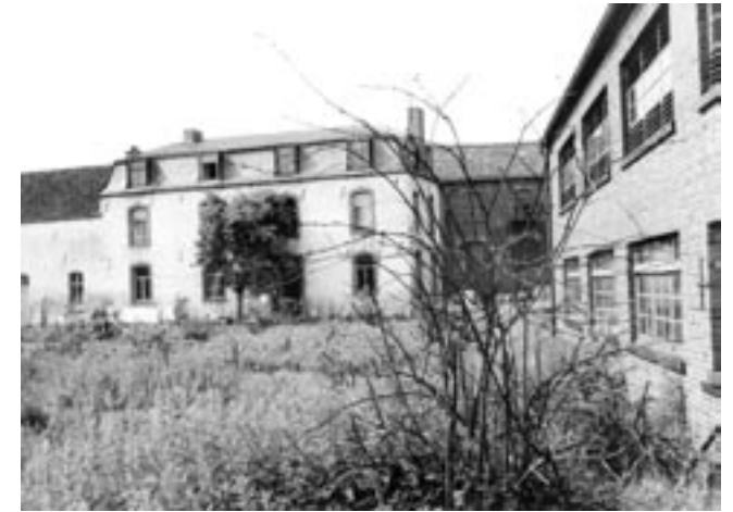
Wildbacher Mühle [2], ca. 1969

Der Blick zurück Richtung Laurensberg fällt auf Gut Schurzelt, in dessen Nähe sich die Untere Schurzelter Mühle (Forellenweg) befand, zuletzt bis 1962 eine Färberei. Bauliche Veränderungen haben kaum noch etwas davon sichtbar gelassen. Über die Brunnenstraße und Ackerstraße erreichen Sie die Rathausstraße, die man ins Zentrum des Stadtteils hinab geht. Ca. 150 Meter hinter dem Bahndamm liegen auf der linken Straßenseite die vorbildhaft restaurierten Gebäude der ehem. ‚Aachener Chemischen Werke für Textil-Industrie‘ , in der früher spezielle Seifen hergestellt wurden. Auf der rechten Seite der Straße gelangt man in ein Neubaugebiet, an dessen Südrand der unter Denkmalschutz stehende