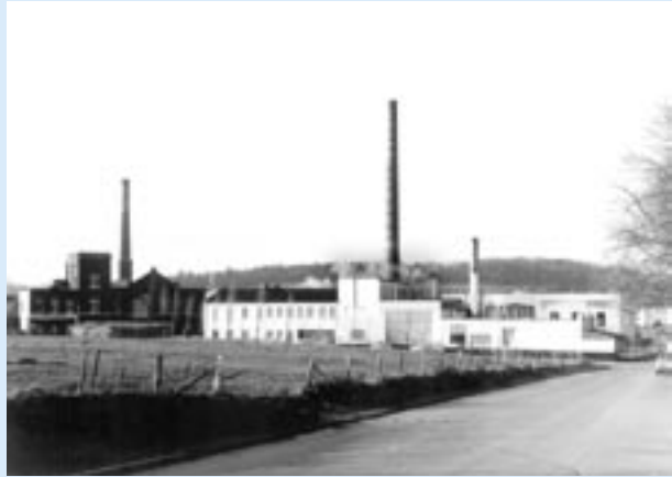
Soerser Mühle [7], 1983

Die Aachener Gewerbelandschaft war über mehrere Jahrhunderte hinweg von der Textilindustrie und deren Zulieferern bestimmt. Tuchfabriken, Spinnereien, Lohnwebereien, Tuchhandlungen, Kleiderfabriken, Textilmaschinen-Hersteller, Schermesser- und Kratzenfabriken prägten das Stadtbild. Die Bäche in und um Aachen spielten eine besondere Rolle bei der Herausbildung dieser Gewerbelandschaft. Sie dienten zum Teil bereits im Spätmittelalter dem Antrieb von Getreidemühlen. Im 16. und frühen 17. Jh. kamen zunächst Hammerwerke und von mechanisch bewegten Blasebälgen angefachte Schmelzöfen der Messingindustrie hinzu. Nadelpolier- und Schleifmühlen, Walkmühlen zum Bearbeiten gewebter Tuche, Wollwaschmühlen, Tuchspülen und schließlich auch Spinnereien und Textilfärbereien siedelten sich an den Bachläufen an. Neben der Nutzung als Energieträger war der geringe Härtegrad des Wassers ein wesentlicher Grund für die Standortwahl. Mit dem Strukturwandel in der Nadel- und Tuchindustrie verloren die Mühlen an Bedeutung. Die letzten Betriebe schlossen zum Ende des 20. Jhs. Besonders am Wildbach im nördlichen Stadtgebiet Aachens, einem 5,3 km langen Bach, der durch den Stadtteil Laurensberg und die von Landwirtschaft geprägte Gemarkung Soers fließt, lässt sich diese weit zurückreichende Nutzungsgeschichte an baulichen Resten, Stauweihern und Mühlengraben nachvollziehen.