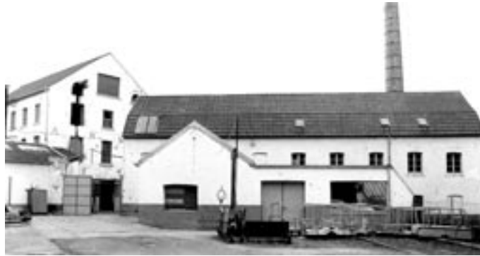
Obere Schurzelter Mühle [1], 1984

Die Aachener Gewerbelandschaft war über mehrere Jahrhunderte hinweg von der Textilindustrie und deren Zulieferern bestimmt. Tuchfabriken, Spinnereien, Lohnwebereien, Tuchhandlungen, Kleiderfabriken, Textilmaschinen-Hersteller, Schermesser- und Kratzenfabriken prägten das Stadtbild. Die Bäche in und um Aachen spielten eine besondere Rolle bei der Herausbildung dieser Gewerbelandschaft. Sie dienten zum Teil bereits im Spätmittelalter dem Antrieb von Getreidemühlen. Im 16. und frühen 17. Jh. kamen zunächst Hammerwerke und von mechanisch bewegten Blasebälgen angefachte Schmelzöfen der Messingindustrie hinzu. Nadelpolier- und Schleifmühlen, Walkmühlen zum Bearbeiten gewebter Tuche, Wollwaschmühlen, Tuchspülen und schließlich auch Spinnereien und Textilfärbereien siedelten sich an den Bachläufen an. Neben der Nutzung als Energieträger war der geringe Härtegrad des Wassers ein wesentlicher Grund für die Standortwahl. Mit dem Strukturwandel in der Nadel- und Tuchindustrie verloren die Mühlen an Bedeutung. Die letzten Betriebe schlossen zum Ende des 20. Jhs. Besonders am Wildbach im nördlichen Stadtgebiet Aachens, einem 5,3 km langen Bach, der durch den Stadtteil Laurensberg und die von Landwirtschaft geprägte Gemarkung Soers fließt, lässt sich diese weit zurückreichende Nutzungsgeschichte an baulichen Resten, Stauweihern und Mühlengraben nachvollziehen.