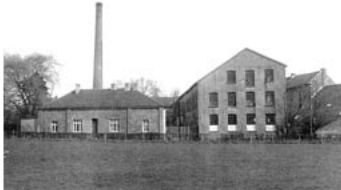
Schleifmühle [5], ca. 1938

Hier beginnt auch der schönere Teil des Wegs: Entlang des Wildbachs, vorbei an einem Regenrückhaltebecken erreichen Sie zunächst die Schleifmühle [5]. Im 16. Jh. wahrscheinlich Kupfermühle, im frühen 19. Jh. Nadelschleif- und Poliermühle, ab ca. 1830 Walkmühle, Wollspüle und Färberei, woraus die Streichgarnspinnerei Wüller hervorging, die bis 1959 bestand. Nach zahlreichen An- und Umbauten ist die frühere industrielle Nutzung der Anlagen nur noch schwer erkennbar. Im Umfeld der Mühle befinden sich noch Mühlengraben sowie ein großer Teich, mit dem das knappe Wasser aufgestaut werden konnte. Wer die Fassaden an der Rütscherstraße genau betrachtet, erkennt Reste des alten, ehemaligen 3-geschossigen Fabrikbaus.